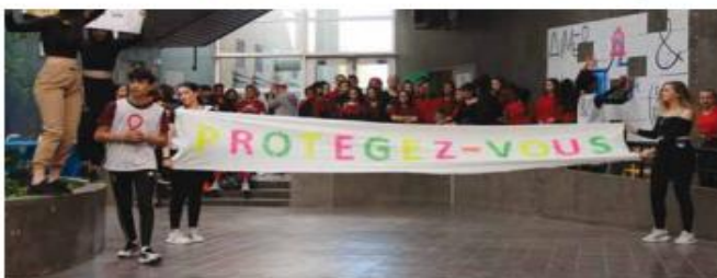
Un engagement collectif