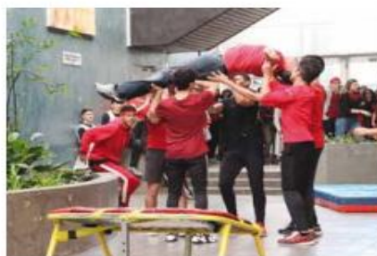
Solidarité et entraide : les mots d'ordre de cette journée d'action contre le SIDA