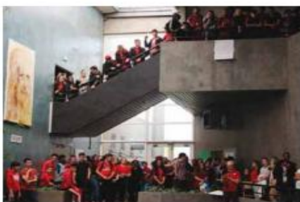
Un engagement collectif avec un dress code : ROUGE