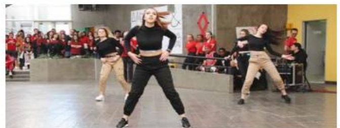
Dynamisme et grâce pour ces magnifiques danseuses