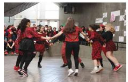
L'occasion de découvrir des danses venues d'ailleurs